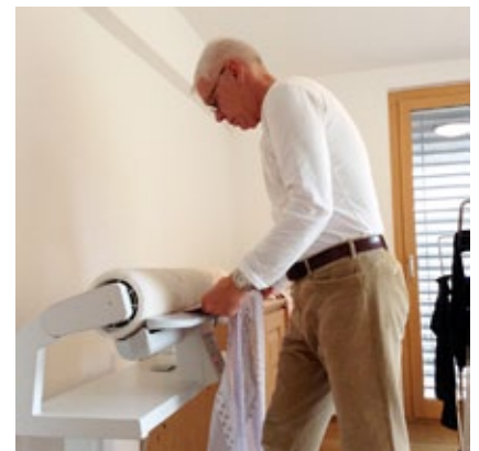
Das bisschen Haushalt ...

Es wäre schön, Sie wieder bei uns im ENGADINERHOF begrüßen zu dürfen. Unterdessen wünschen wir Ihnen alles Gute, Gesundheit und Glück!