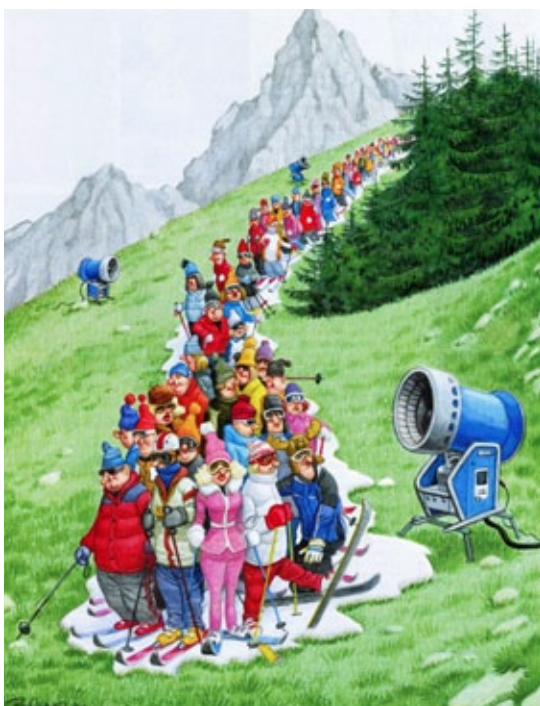
Illustration: Bruno Haberzettl

So mussten wir am 19. Dezember in die Wintersaison starten. Zum Glück liessen Sie sich, liebe Gäste, weder vom wenigen Schnee noch vom schwächelnden Euro abhalten. Dafür möchten wir uns einmal mehr ganz herzlich bei Ihnen bedanken .